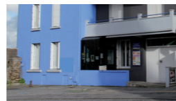
siège administratif du centre

2 La Maison des Isles Allée Claude Choëmet