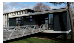
Le CSC, c'est également 2 maisons d'animation à Rezé.

2 La Maison des Isles Allée Claude Choëmet