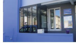
siège administratif du centre

2 La Maison des Isles allée Claude Choëmet