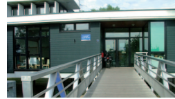
Le CSC, c'est également 2 maisons d'animation à Rezé

2 La Maison des Isles allée Claude Choëmet