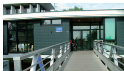
Le CSC, c'est également 2 maisons d'animation à Rezé

2 La Maison des Isles allée Claude Choëmet