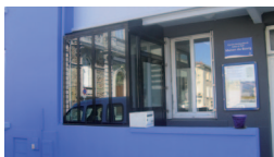
siège administratif du centre

2 La Maison des Isles allée Claude Choëmet