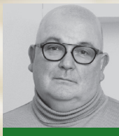
Franck RENAUD Investigation Editions Stock