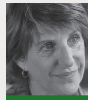
Isabelle De LISLE Développement personnel Editions Le Souffle d'Or L'auteur vous convie également à une lecture chuchotée de ses contes hypnotiques. www.isabelle-de-lisle.com