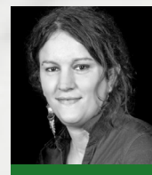
Emmanuelle LESCAUDRON Thriller écologique Ed. Les Presses littéraires