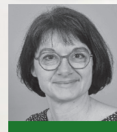
Béatrice NOURRY Romans historiques et régionaux Editions Petits Pavés