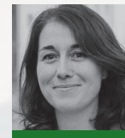
Laurence THIÉVIN Développement personnel Ed. Dunod www.numerologie-creative.com