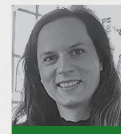
Lia NAULEAU Thriller transgenre Editions 2L