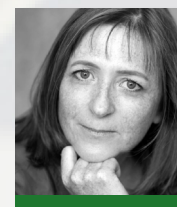
Anne RIVIÈRE Jeunesse et Young adult Autoédition www.anne-riviere.com