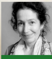
Sylvie BEAUGET Roman, nouvelles Éditions Rhubarbe